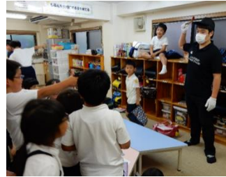
あつという間に人気者の不審者くん

と、声を掛けられたりいきなり連れて行かれそうになった場合はすぐに助けを求めることを伝え、防犯ブザーの活用を再確認しました。今後も定期的の実施していき、いざというときの対策に努めていきたいと思ひます。