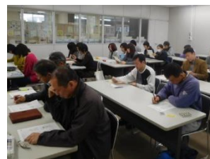
真剣にそして楽しく

改めて安全運転に努めなくてはと、気を引き締める1日となりました。3月18日(日)、東広島市市民協働センターにて安全運転講習会を開催しました。普段、陽だまりクラブでドライバーをしている活動者の他、利用者様の自宅へ車またはバイクで移動するヘルパーも参加し、計28名が安全運転を再確認しました。講習にあたり、東広島警察署にご協力いただきました。ありがとうございました。