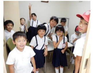
奥の部屋に逃げたよ