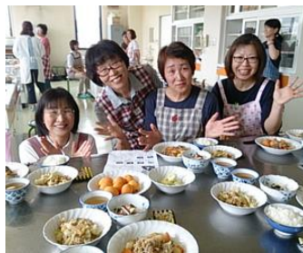
調理実習～美味しい薄味～

そして、6月。申込者多数の難関を突破し（笑）、目標の一つである実技の外部研修へ3人が参加しましたので、早速伝達講習をする予定です！