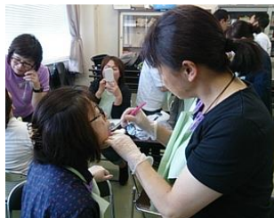
口腔ケア実技研修

そして、6月。申込者多数の難関を突破し（笑）、目標の一つである実技の外部研修へ3人が参加しましたので、早速伝達講習をする予定です！