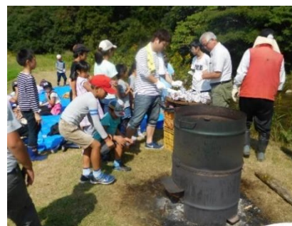
地域のひとと芋ほり(河内町)

お姉さんの存在は子どもたちにとって大きな魅力だったようです。さらに、7月からは経験豊富な元中学校の先生を常勤スタッフに迎えることができました。