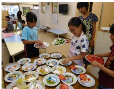
ボランティアさんとベーグルづくり

体験活動では学生団体や地域の協力をいただき、クッキングや工作、遠足やスケッチなどの野外活動、国際交流などを計24回実施しました。また、避難訓練を3回実施し、火災や地震等の災害が発生したときに安全に避難できるよう手順を確認し、訓練しました。