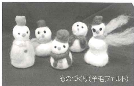
ものづくり(羊毛フェルト)