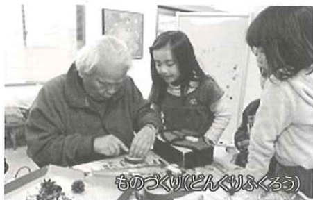
ものづくり(どんぐりふくろう)